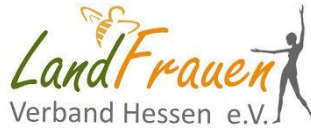
LandFrauen Verband Hessen e.V.