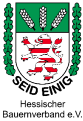
Hessischer Bauernverband e.V.