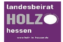
landesbeirat HOLZ hessen www.holz-in-hessen.de