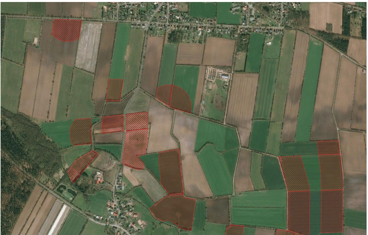
Abbildung 2: Beispiel für ein Referenzgebiet mit Streifen- und Halbkreis-Taxationsflächen ( ST_{Circplot} ) (erstellt von H. Schmäuser, Schleswig-Holstein)