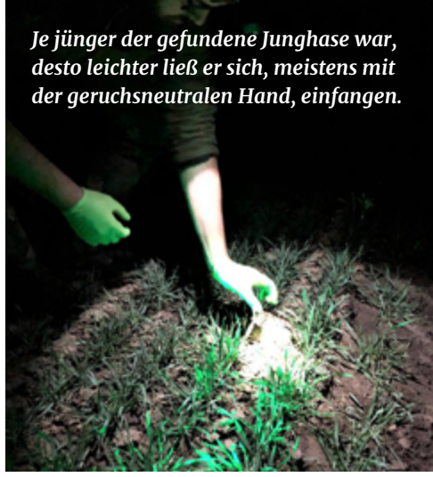
Je jünger der gefundene Junghase war, desto leichter ließ er sich, meistens mit der geruchsneutralen Hand, einfangen.