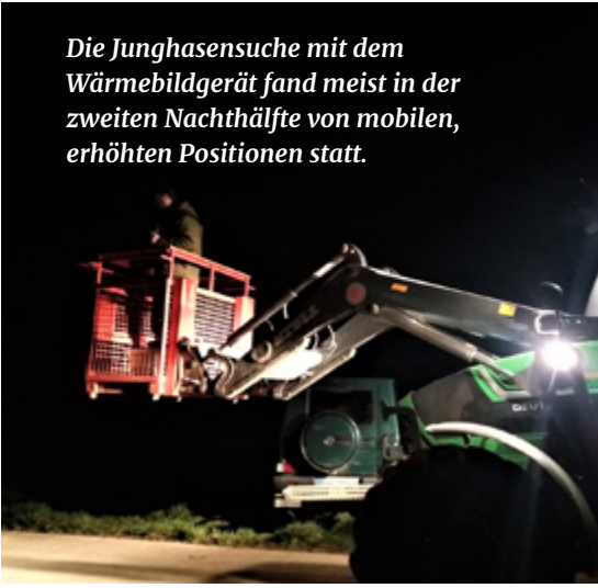
Die Junghasensuche mit dem Wärmebildgerät fand meist in der zweiten Nachthälfte von mobilen, erhöhten Positionen statt.