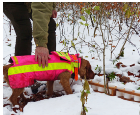
Mittels Dosen oder kleiner Becher, die z. B. Wildbret oder Schwartenfetzen in verschiedenen Verwesungsstadien beinhalten, wird der Hund eingearbeitet. Alle verwendeten Teile vom Schwarzwild müssen auf das Aujeszky-Virus untersucht werden. Hat der Hund wie gewünscht verwiesen, erfolgt ein ausgiebiges Lob oder Spiel.