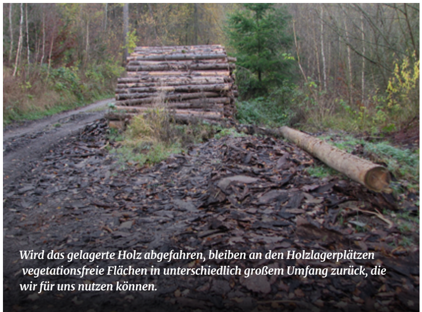
Wird das gelagerte Holz abgefahren, bleiben an den Holzlagerplätzen vegetationsfreie Flächen in unterschiedlich großem Umfang zurück, die wir für uns nutzen können.

Zur Einsaat eignet sich besonders Weißklee. Weißklee ist eine anspruchslose Leguminose, die mit den oft sauren Waldböden problemlos zurechtkommt. Auch stauende Nässe erträgt die Pflanze relativ gut. Sie gedeiht damit ebenso auf Standorten, auf denen andere Kleearten (Rotklee) schon nicht mehr gedeihen. Durch oberirdische Kriechtriebe (Stolonen), die sich rasch bewurzeln, bildet er schnell dichte und sich ausbreitende Bestände. Er wandert in lückige Vegetationsbestände ein und ist in der Lage, diese Lücken in der Vegetationsdecke zu schließen. Weißklee ist absolut tritt- und verbissfest. Rotwild und auch Damwild nehmen den Weißklee problemlos und in großen Mengen an. Das Rehwild äst bevorzugt die Blütenstände, nimmt aber nach eigenen Beobachtungen auch