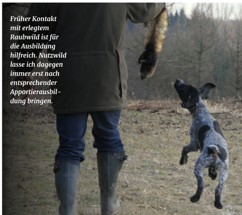
Früher Kontakt mit erlegtem Raubwild ist für die Ausbildung hilfreich. Nutzwild lasse ich dagegen immer erst nach entsprechender Apportierausbildung bringen.

Was aber sollte bzw. kann man sinnvollerweise in diesen Herbst-/Wintermonaten mit seinem Junghund alles machen, um ihn auf die kommende Ausbildung sinnvoll vorzubereiten?