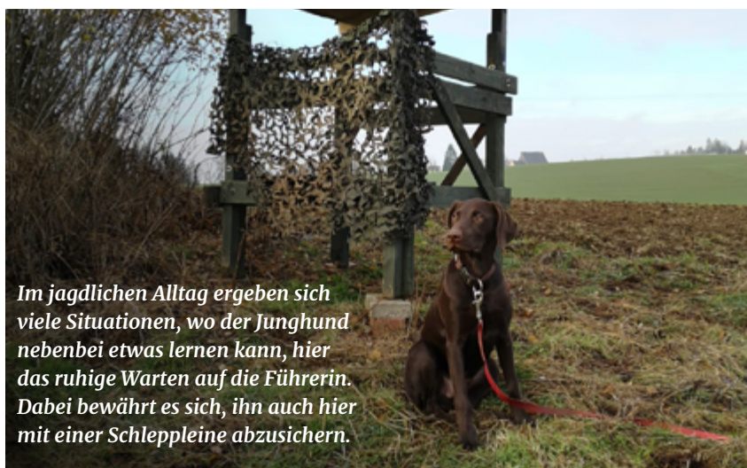
Im jagdlichen Alltag ergeben sich viele Situationen, wo der Junghund nebenbei etwas lernen kann, hier das ruhige Warten auf die Führerin. Dabei bewährt es sich, ihn auch hier mit einer Schleppe abzusichern.

Aber wo werden denn besonders häufig Fehler gemacht, die hinterher oft nur mit viel Mühe wieder ausgebügelt werden müssen: