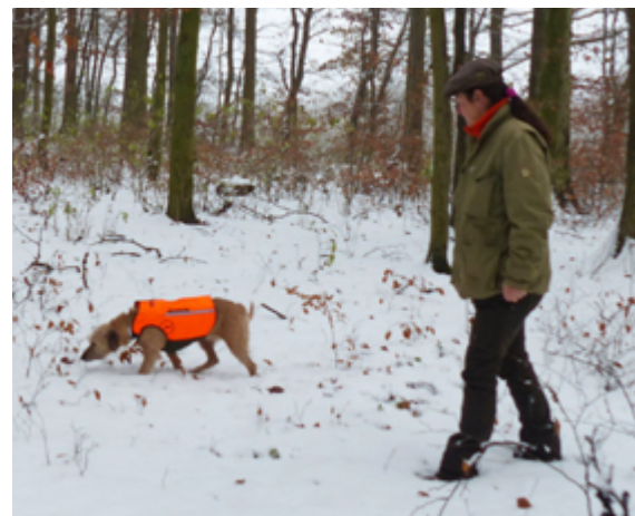
Der Hund sucht im Umkreis von 30-40 Meter um den Hundeführer und muss stets abrufbar sein.

Wir danken der Abteilung V 4 des HMUKLV für die bisherige gute Zusammenarbeit. ■ Markus Stifter