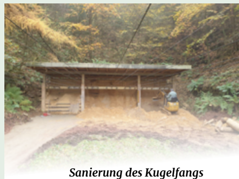
Sanierung des Kugelfangs

Mitarbeit vieler Vereinsmitglieder zunächst eine Ertüchtigung der Elektroinstallationen der Langwaffen- und der Keiler-Bahnen, des Kugelfangs des Kurzwaffenstandes, sowie eine Renovierung der bestehenden Anlagen ermöglicht worden. Nun können mit den Mitteln aus der Jagdabgabe die