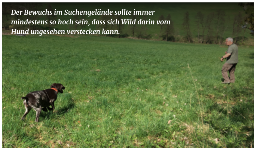
Der Bewuchs im Suchengelände sollte immer mindestens so hoch sein, dass sich Wild darin vom Hund ungesehen verstecken kann.

Häufig werden auch beim Training der Schussfestigkeit Fehler gemacht, die mit Anleitung durch erfahrene Führer nicht sein müssten. Es wird in der Nähe des Hundes (oft mehrfach) geschossen, ohne groß auf Gelände (Tal, Waldrand, ...) und den aktuellen „Gemütszustand“ des Welpen/Junghundes zu achten. Klar, das Schießen sollte der Hund unbedingt so frühzeitig wie möglich positiv kennenlernen. Er sollte